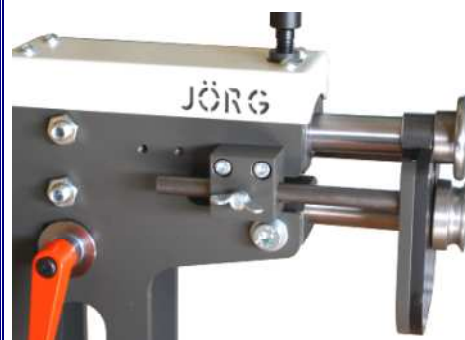
Detail van de baardplaat / verstelbare aanslag